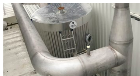
Production de froid et de récupération de chaleur en agro-alimentaire