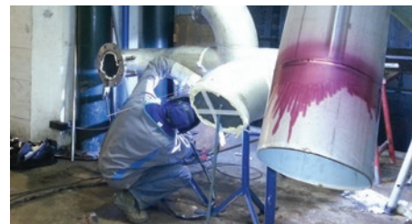
Travaux de maintenance tuyauterie et chaudronnerie pour barrage hydroélectrique