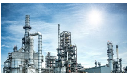
Revamping de la chaudronnerie d'une unité d'incinération site chimique