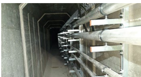
Distribution inox en soudure orbitale d'eaux thermales