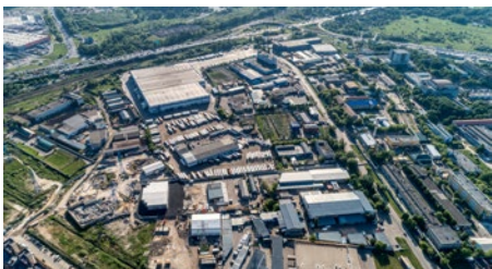
Contrat de maintenance pluriannuel process & facilities