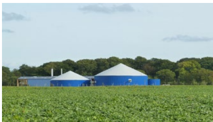
Travaux de tuyauterie et métallerie pour unité de méthanisation